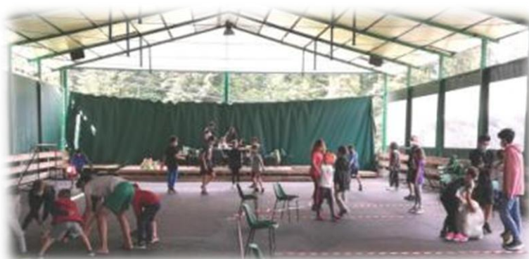
La mattinata dei figli: gli educatori propongono un percorso di formazione in modalità ludica.