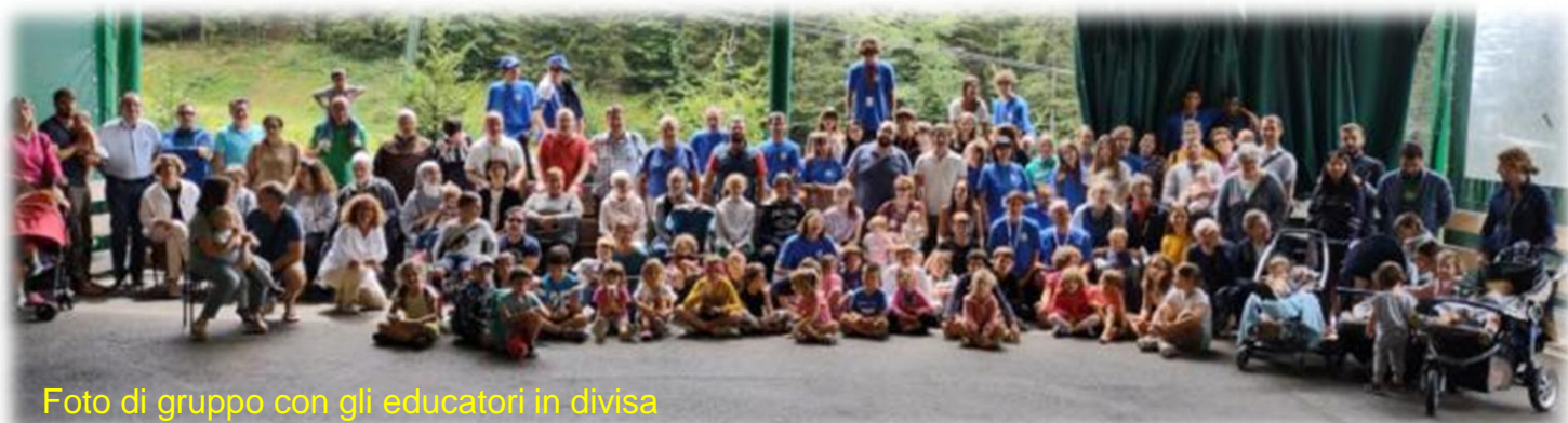
Foto di gruppo con gli educatori in divisa

WhatsApp: 349.210.5506 email: formazione.st@gmail.com