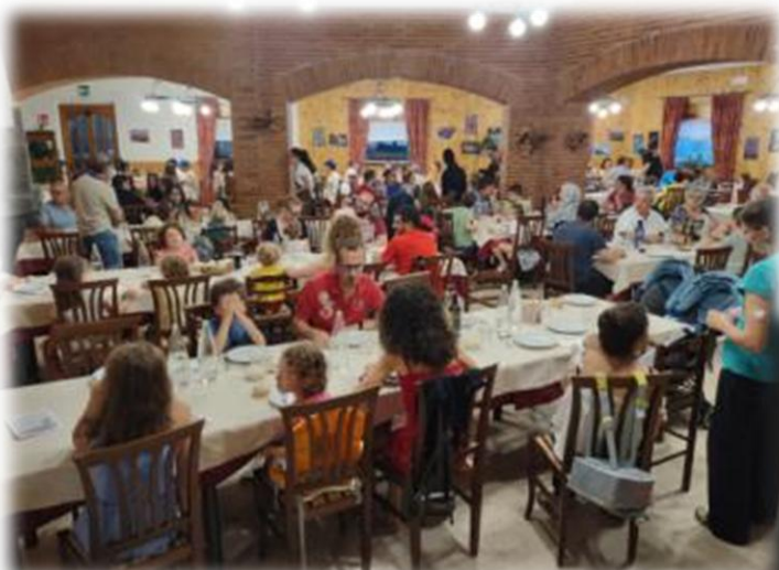
A pranzo tutti insieme

Modalità di pagamento: vedi www.camen.org