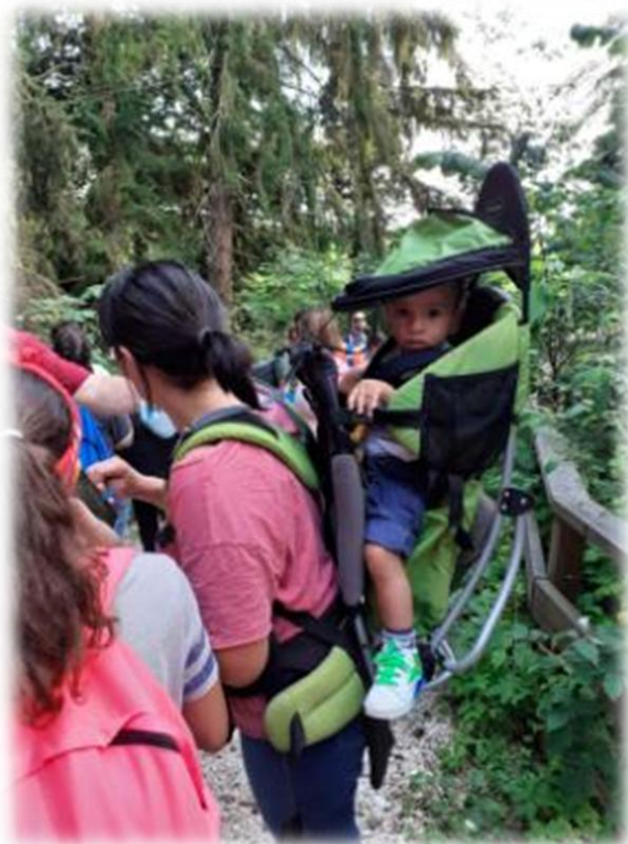
nel pomeriggio vacanza libera