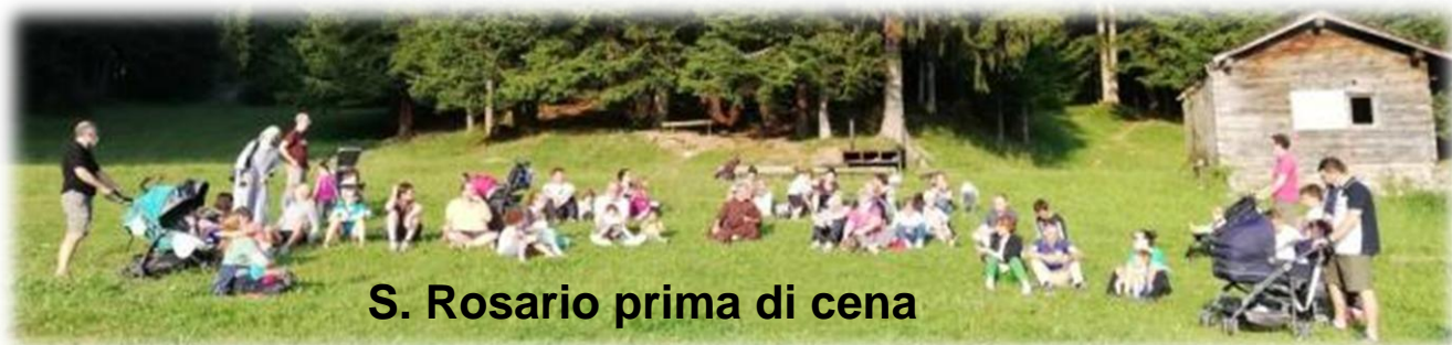
S. Rosario prima di cena

Serata in compagnia dei docenti per una discussione libera. Una sera dopo cena: un breve momento di adorazione eucaristica. È sempre presente per l'intera settimana un sacerdote a disposizione delle famiglie, degli educatori e dei figli.