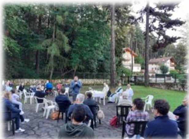
La mattinata degli sposi: S. Messa e lezioni